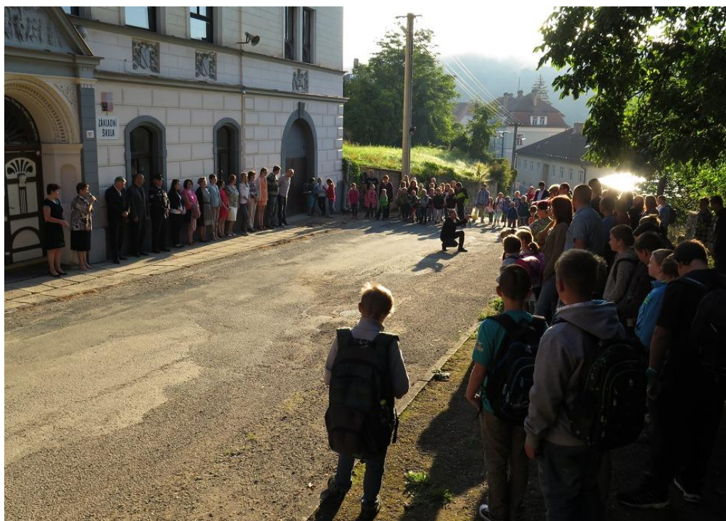
Do školy nastoupilo 14 prvňáčků.