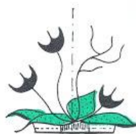
Schéma tří základních prvků ikebany